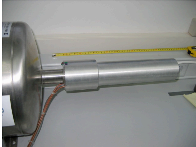
Figura 1. Detector de germanio