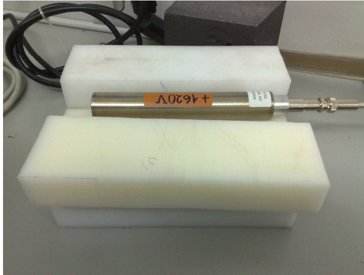
Figura 1. Cámara proporcional de ^3\text{He} y bloques de material moderador (polietileno).